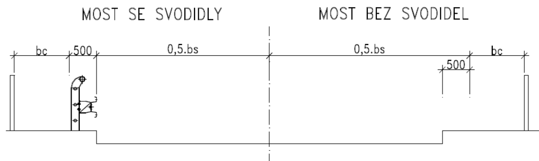
Obr.1 - Schéma šířkového upořádání na mostě pro variantu se svodidly a bez nich

Nejsou-li na mostě svodidla, uvažuje se šířka komunikace b_s (tj. šířka její zpevněné části) s přesahem 0,5m do chodníku (viz. Obr.1). Tato hodnota přesahu se pro určení průchozího prostoru b_c odečte od skutečné šířky chodníku (viz. Obr.1).